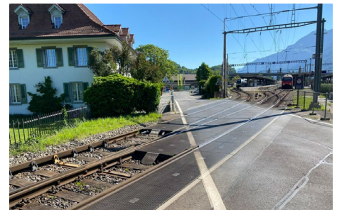
Bahnübergang Du Lac