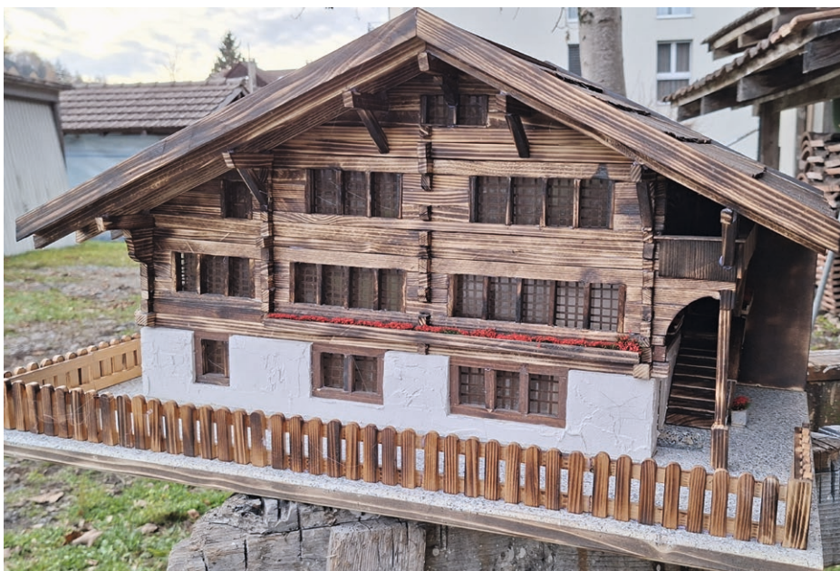
Das fertig gebaute Beundenhaus-Modell

herbergt heute, nebst Wohnungen und einem Sitzungszimmer, auch die Brockenstube des Frauenvereins.