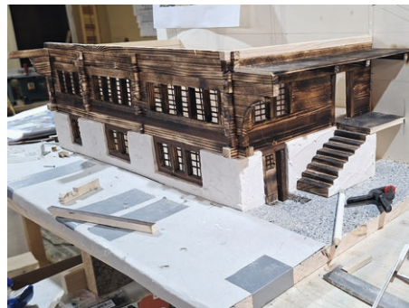
Während des Baubeginns

Die nächsten Fotos zeigen die verschiedenen Arbeitsschritte beim Entstehen des Modells.