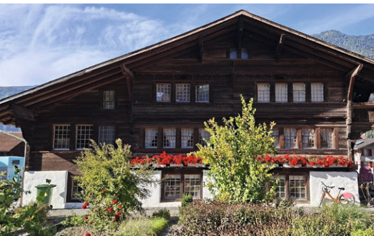
Das Beundenhaus Original

Das Beundenhaus ist im Besitz der Gemeinde Matten. Es wurde im Jahr 1643 durch den Zimmermeister Heinrich Tschiemer erbaut und be-