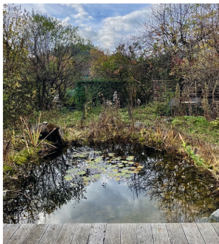
Der Naturteich als Herzstück des Gartens