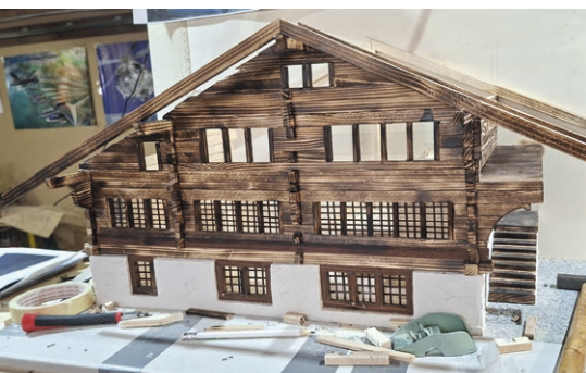
Das Haus ist «aufgerichtet».